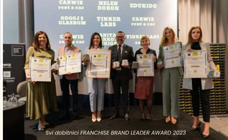
Svi dobitnici FRANCHISE BRAND LEADER AWARD 2023